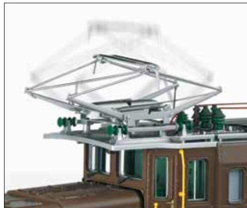
Motorisch heb- und senkbare Stromabnehmer

Zusammen mit den neuen Personenwagen 31522 und 31522 sowie dem neuen Gepäckwagen 34553 kann ein typischer Personenzug der RhB aus den 60er-Jahren nachgebildet werden.