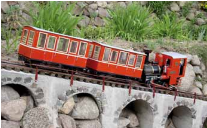
Zahnradlok – es geht bergauf. (Seite 13)