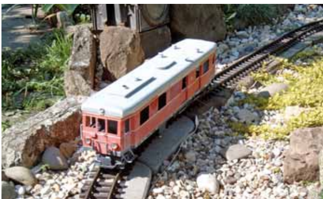
Ganz schöner Brocken – T3 der Harzer Schmalspurbahn. (Seite 16)