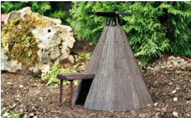
Köhlerhütte zum Selbstbauen. (Seite 29)