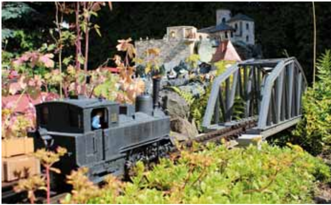
Gartenbahn rund um die Burg. (Seite 4)