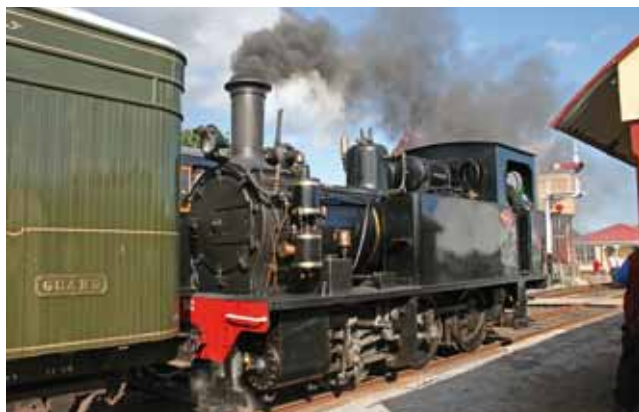
Reisebericht: Downunder 2013