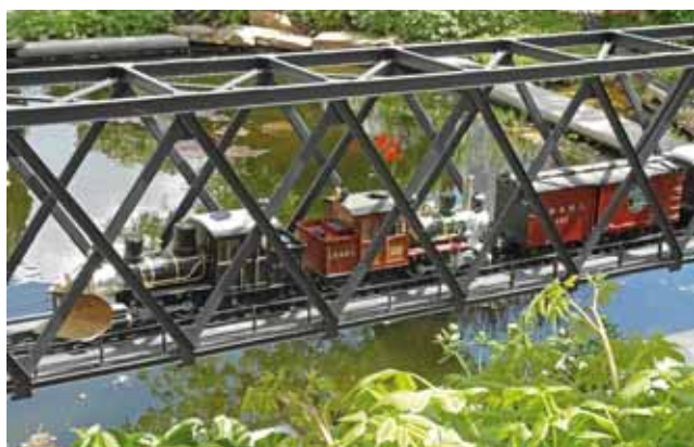
Anlagenporträt: Gartenbahnanlage aus Chemnitz