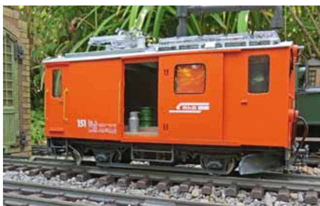
Modellbau: RhB-Triebwagen-Bausatz von EFFE2Model