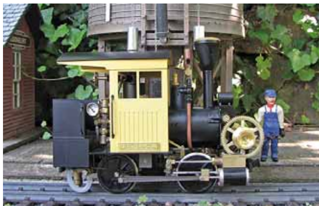
Live Steam: GYPSY