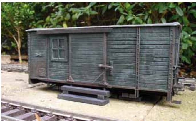
Wagenkasten als Stellwerk. (Seite 22)