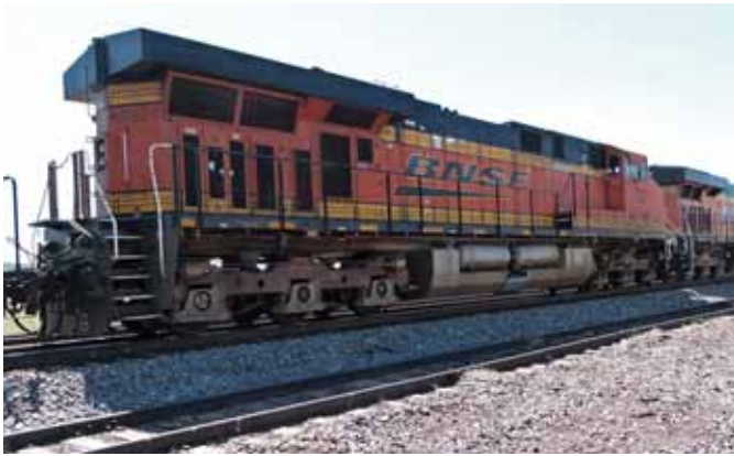
Eisenbahnen in USA. (Seite 4)