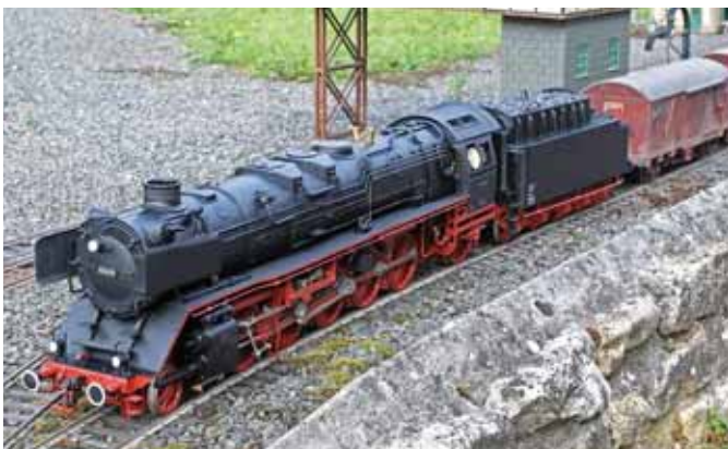
BR45 von Accucraft in Spur 1 (Seite 44)