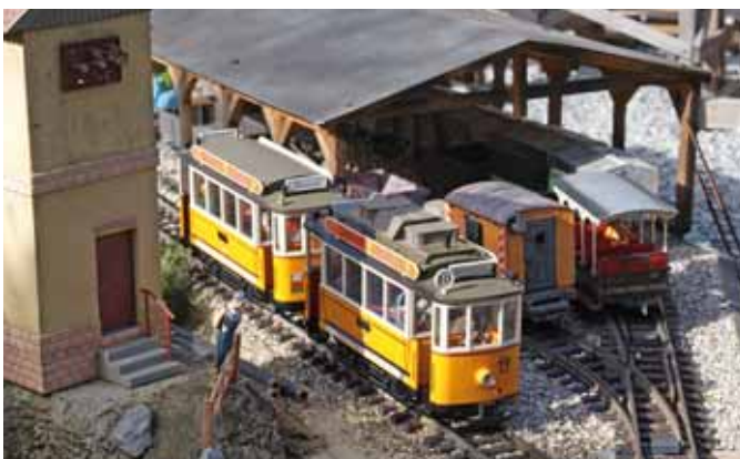
Straßenbahn mit Akku-Antrieb. (Seite 32)